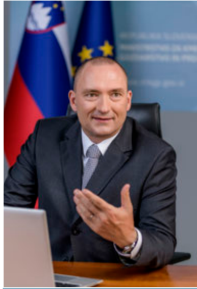
dr. JOŽE PODGORŠEK, minister za kmetijstvo, gozdarstvo in prehrano

1. Leto 2021 je pred kmetijstvo postavilo mnoge izzive. Razkorak med cenami gnojil, krme in energije ter odkupnimi cenami kmetijskih pridelkov je rekorden. Spodbude imajo v nestabilnem okolju pomembno vlogo. Pred nami so zahtevni cilji bodoče skupne kmetijske politike. Kakšna je dolgoročna vizija slovenskega kmetijstva, kako vi vidite slovensko kmetijstvo leta 2050 in kakšna je v tej prihodnosti vloga kmetijskih zadrug?